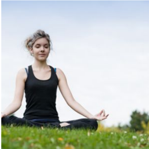
I feel very good